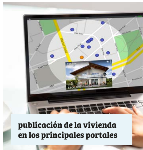
publicación de la vivienda en los principales portales