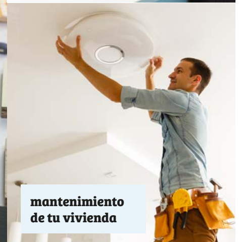
mantenimiento de tu vivienda